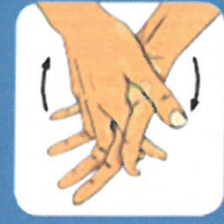
4 Frotter entre les doigts