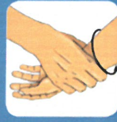
8 Terminer par les poignets