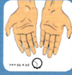
9 Frotter jusqu'au séchage complet des mains. Ne pas rincer, ni essuyer