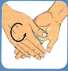
2 Frotter largement paume contre paume