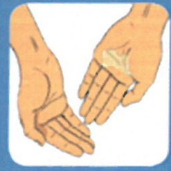
1 Deposer le produit dans le creux de la main