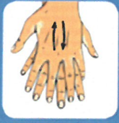
3 Frotter l'un après l'autre le dos de chaque main