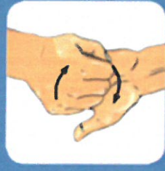
5 Frotter le dos des doigts contre la paume de l'autre main