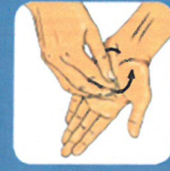
7 Insister sur le bout des doigts et les ongles pour chaque main